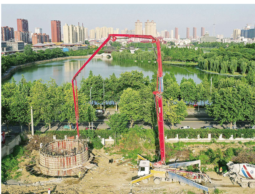
在西湖路，西湖至北湖生态补水工程正在进行混凝土浇灌。