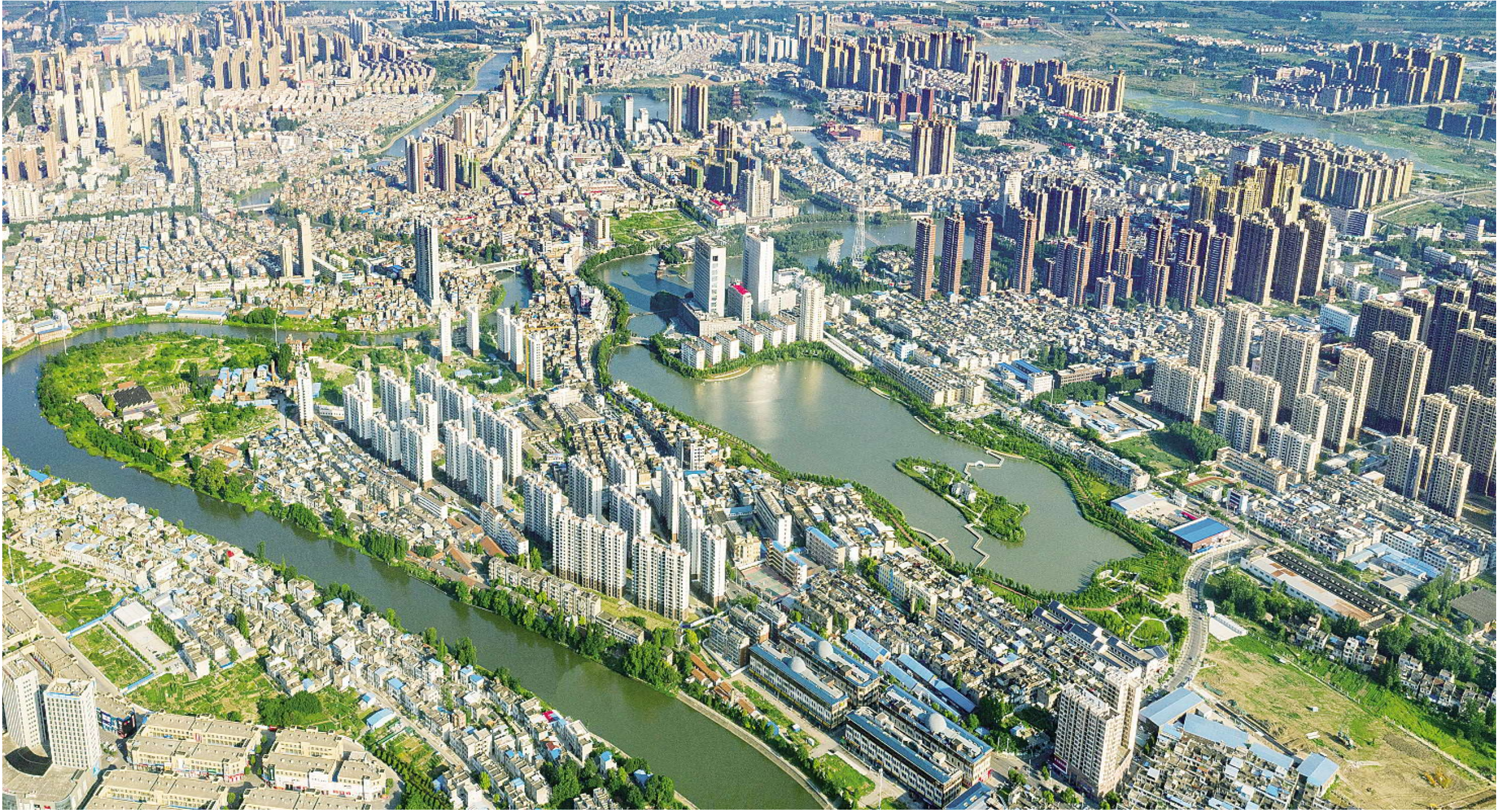
鸟瞰竟陵，水生态文明建设增色一座城。