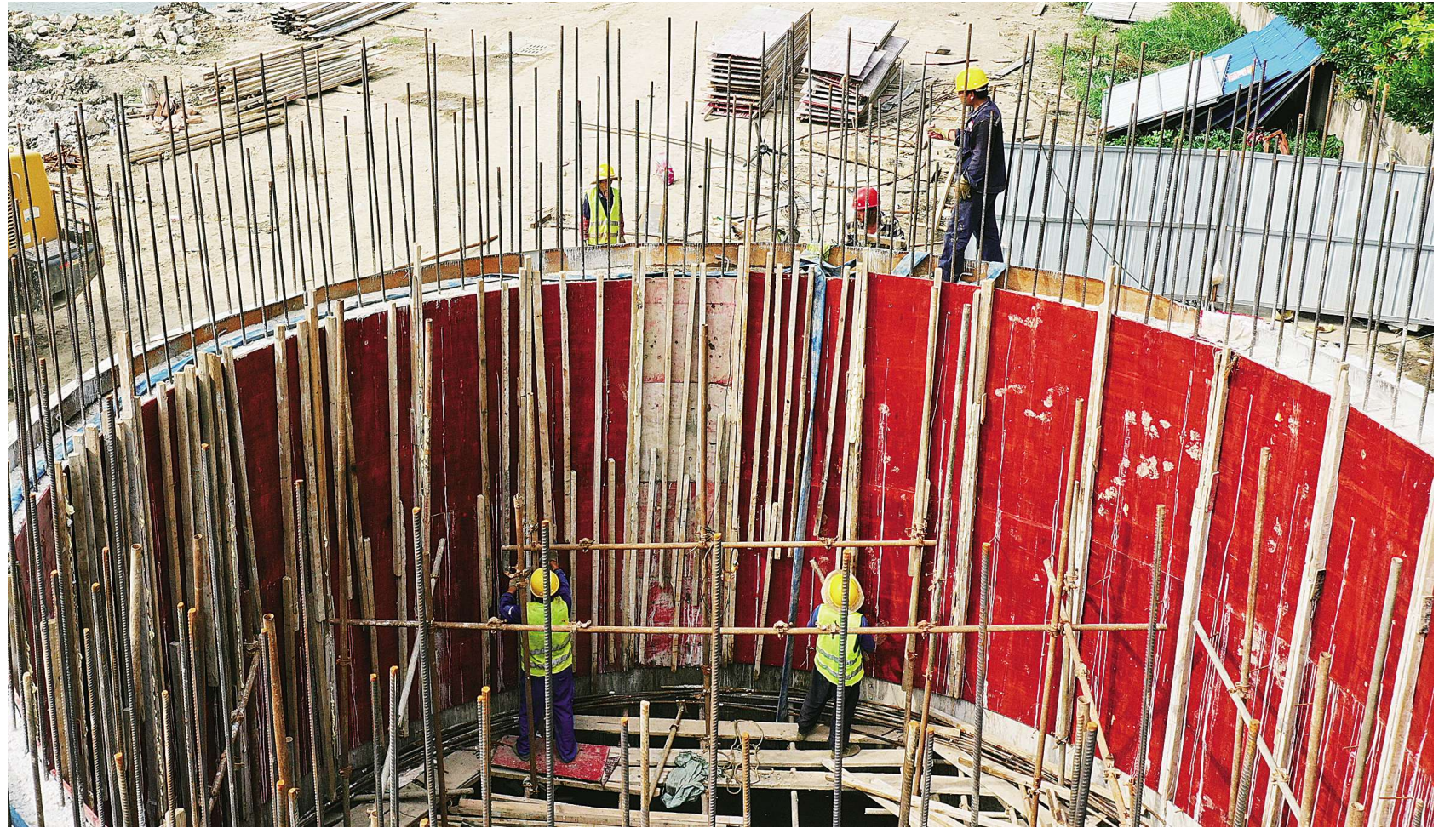
在西湖路，西湖至北湖生态补水工程正在拆模。

近几年来，我市先后对东湖、西湖、小南湖、北湖及天门河、汉北河、湛桥河、杨家新沟、东风干渠、龙嘴河实施改造整治，城区河湖水质常年达到三类以上。为完善城区东湖、西湖、小南湖、北湖“四湖”的生态补水系统，加快推动水生态文明建设，今年5月，我市投入近3000万元，启动西湖至北湖生态补水工程，建设包括10个工作井、11个接收井以及3座水闸，将东风干渠的汉江水从西湖南侧引入北湖，届时东湖、西湖、小南湖、北湖水系连通，水质将得到进一步改善。目前，生态补水工程建设已全面展开，预计今年底完工。