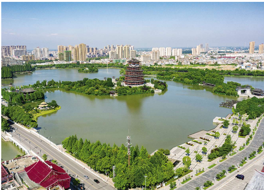
汉江水将西湖润成郁郁葱葱的城中明珠。